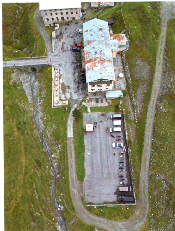
Berghotel mit Start / Ziel und Parcours von oben